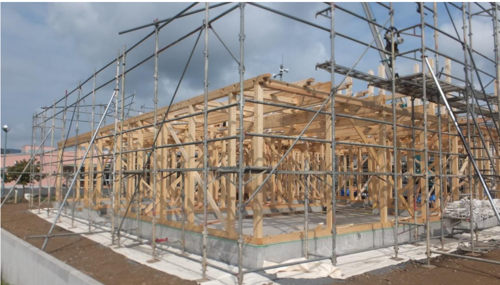
全木連事務所新築工事 令和4年9月20日 建て方 1F横架材 (樹種)、(原産地)