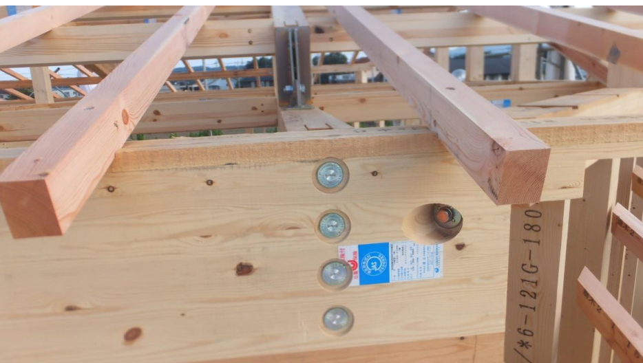
ア) 全木連事務所新築工事 イ) 令和4年9月25日 ウ) 建て方 エ) 横架材(梁) (樹種)、(原産地)